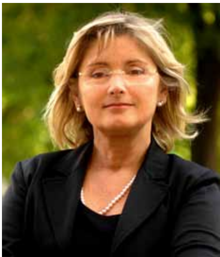
TERESA MARZOCCHI Assessore Politiche Sociali Regione Emilia-Romagna

La collaborazione tra Regione e Agenzia delle Entrate prosegue anche nel 2010, permettendo la presentazione di uno strumento quale la “Guida alle agevolazioni e contributi per le persone con disabilità”, vale a dire un concreto strumento informativo e di supporto pratico sulle agevolazioni fiscali e per l'autonomia personale, l'attività di assistenza, la vita indipendente, la mobilità, l'accessibilità e la fruibilità degli spazi di vita quotidiana.