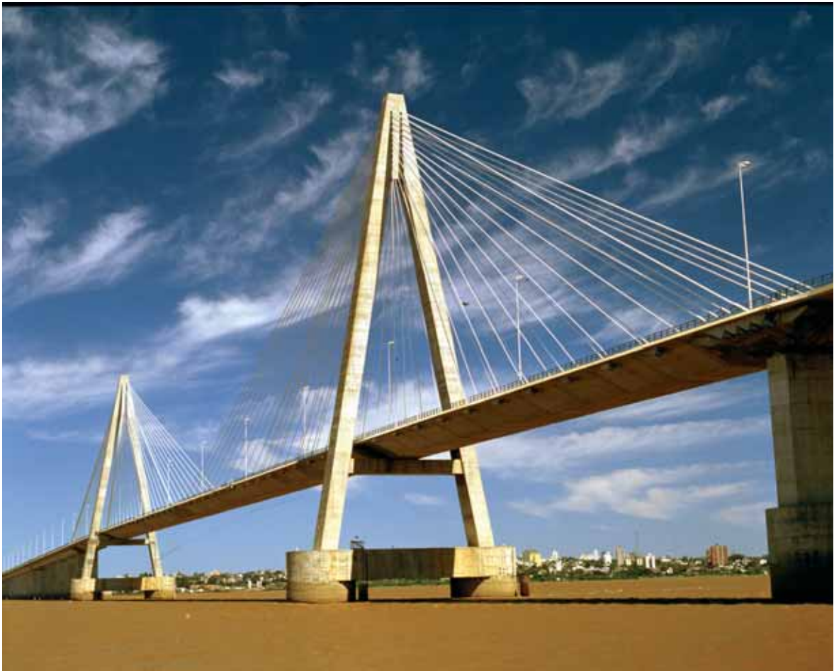
Ponte Posadas Encarnación, Argentina, Paraguay, Impregilo spa

subnazionale, dell'intero continente, attraverso la costruzione di infrastrutture destinate ai trasporti, all'energia e alle telecomunicazioni. Tali infrastrutture permetteranno da un lato l'armonizzazione della regolamentazione riguardo l'utilizzo delle infrastrutture transazionali (valichi di frontiera, sistemi di trasporto multi modale e trasporto aereo) e dall'altro l'integrazione subnazionale fra i territori direttamente interessati dai grandi Corridoi trasversali, coinvolgendo anche le aree periferiche vicine.