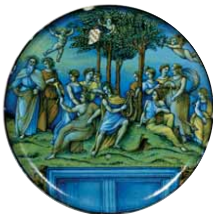
Coppa in maiolica della bottega di Pietro Bergantini di Faenza, 1531