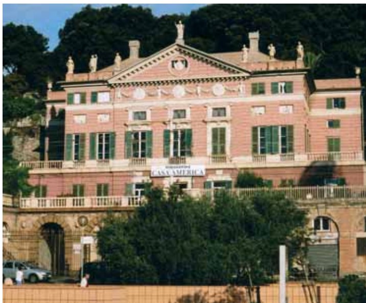
Villa Rosazza, sede della Fondazione Casa America

Aires; Casa Museo Garibaldi, Montevideo; Universidad Centroamericana de Nicaragua; Museo del Periodismo y las Artes Gráficas, Guadalajara; Gobierno Regional del Callao, Lima; Corporación Andina de Fomento, Caracas; Banco Centroamericano de Integración Económica, Tegucigalpa; ecc.