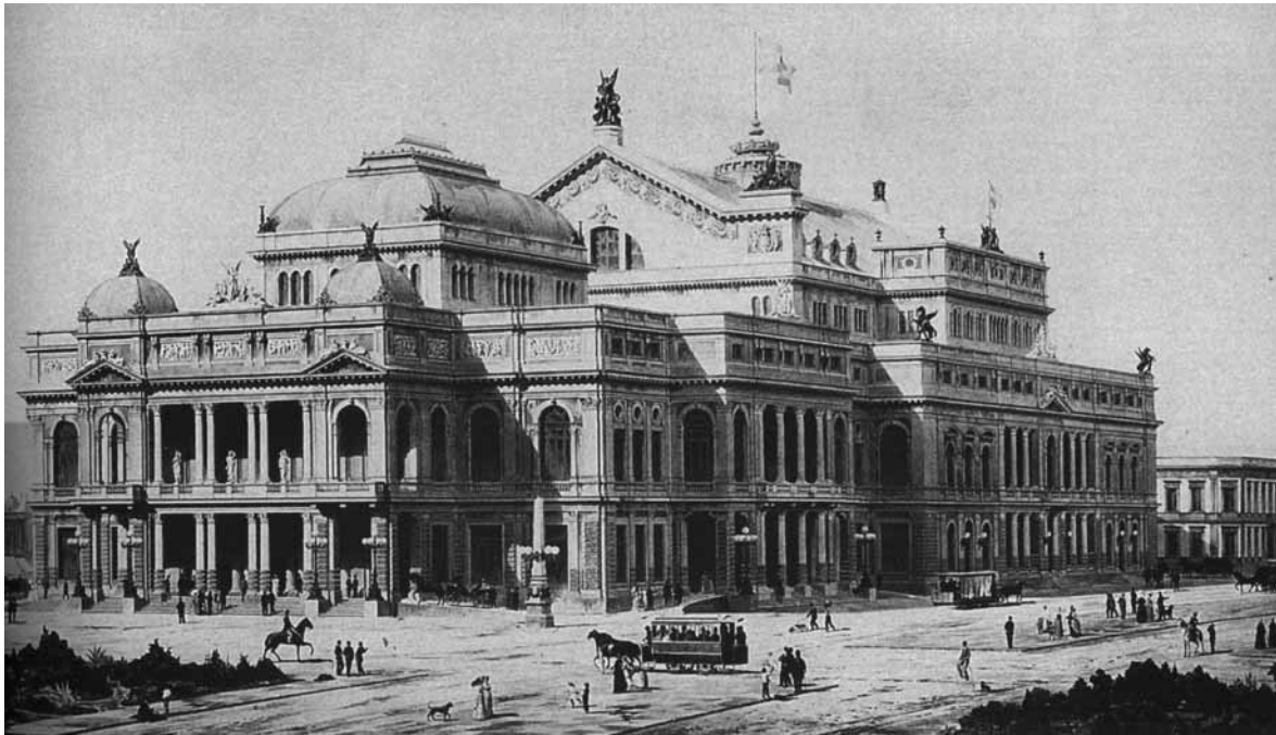
Teatro Colón, prospettiva.

• Intesa interregionale "Brasil proximo" concordato con 5 regioni italiane (Marche, Umbria, Emilia Romagna, Liguria e Toscana) col fine di promuovere un progetto triennale di cooperazione e solidarietà internazionale per lo sviluppo locale integrato in Brasile.