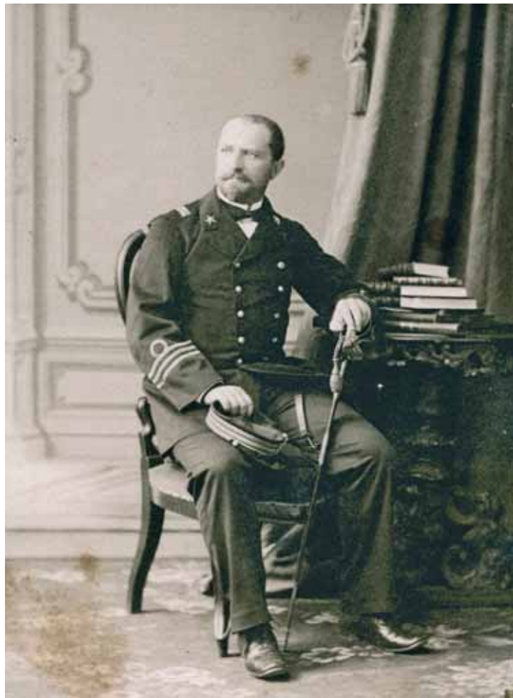
G. Bove (da Bove G., Note di un viaggio nelle Missioni ed Alto Paraná , Genova, 1887)

Giacomo BOVE (Maranzana d'Acqui 1852 - Verona 1887). Ufficiale della Regia Marina Italiana, compì vari viaggi nei paesi del cono sudamericano, ove raccolse una cospicua collezione riguardante gli Ona e gli Yaghan della Terra del Fuoco ed i Tehuelche della Patagonia.