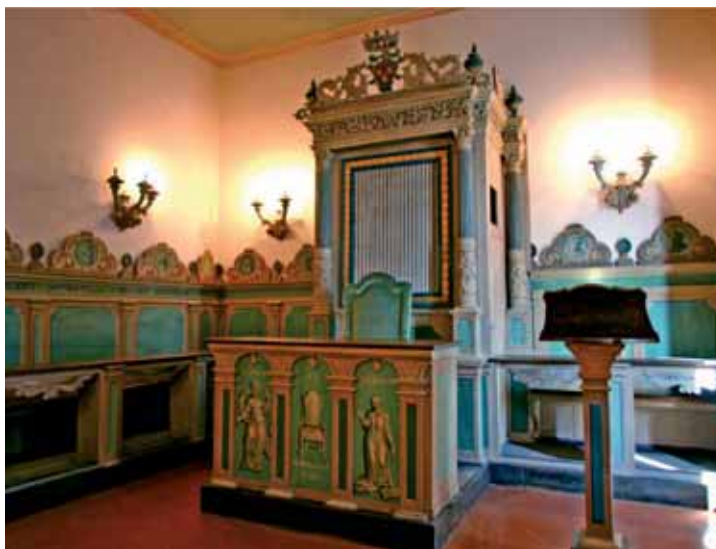
Università di Camerino: Aula Scialoja (secolo XVIII)

presso la School of Advanced Studies di UNICAM. Lunch-Bufferet.