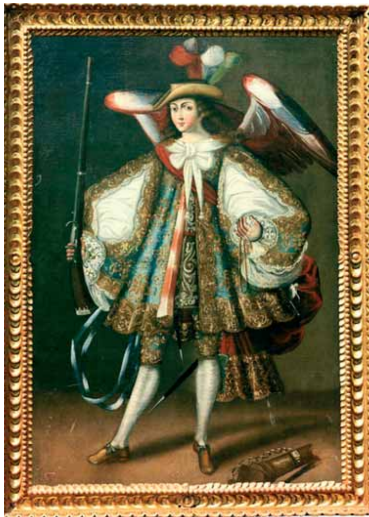
San Miguel Arcangel, anonimo della Scuola di Cuzco, secolo XVII, Coll. Privata, Città del Messico

restano tuttora tracce di grande rilievo. Più tardi, poco dopo il distacco dalla Spagna, iniziò una nuova e analoga migrazione. Seguì nella seconda metà del secolo XIX una partecipazione lombarda all'emigrazione italiana di massa soprattutto ma non solo in Brasile, Argentina e Costa Rica; e in tempi più vicini a noi una rilevante emigrazione nel Venezuela. Come lombardi siamo dunque direttamente implicati