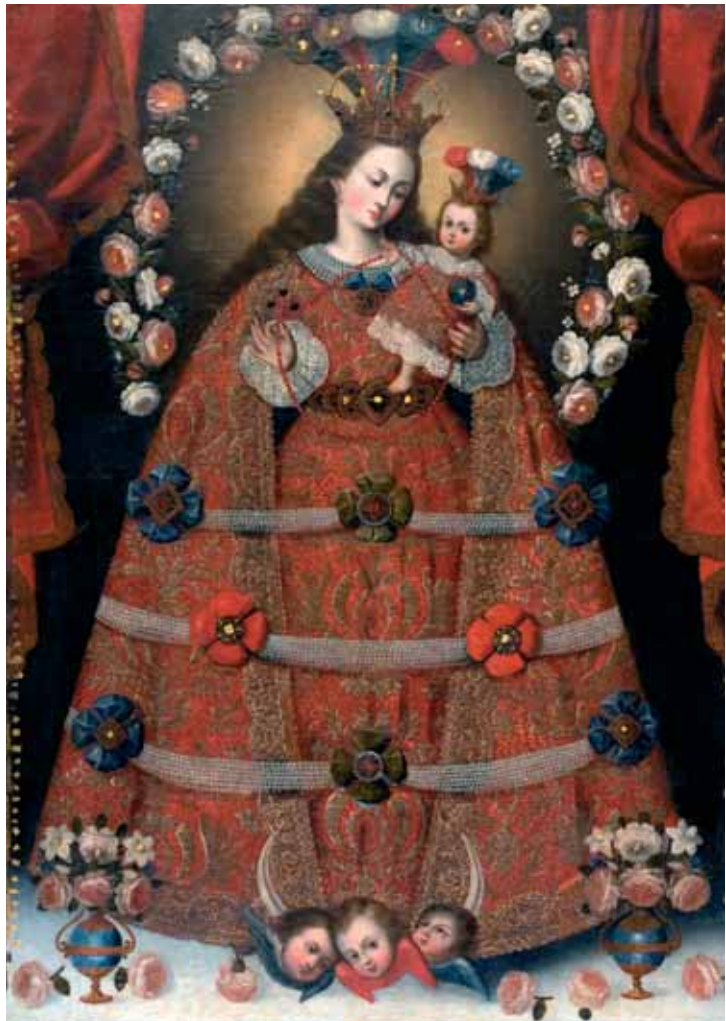
Virgen del Rosario de Pomata. Olio su tela, anonimo della Scuola di Cuzco, secolo XVII, Museo de Arte Colonial, Bogotá

nella nascita dell'identità latino-americana; e ne siamo ben lieti poiché quello dell'America Latina è il più riuscito caso di meticciato culturale dell'epoca moderna. Niente di simile accade altrove, dove gli autoctoni vennero invece respinti ed esclusi dal nuovo mondo che nasceva; dove la loro strage continuò ben oltre il momento drammatico e convulso della conquista, e dove infine i pochi superstiti vennero